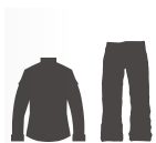
Костюм літній польовий (2 комплекти)